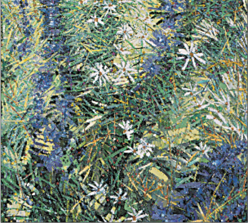
BERTRAND TREMBLAY: LES GRANDES VIPÉRIDES/PHOTO: L. LEBLANC

Un objet d'art n'a pour seule fonction que d'être agréable à la vue, d'être beau et de nous faire rêver.